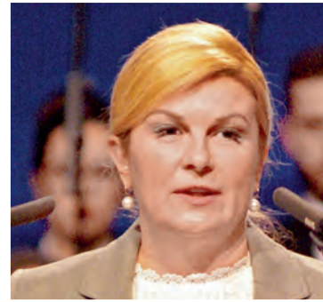
K. Grabar Kitarović, Predsjednica