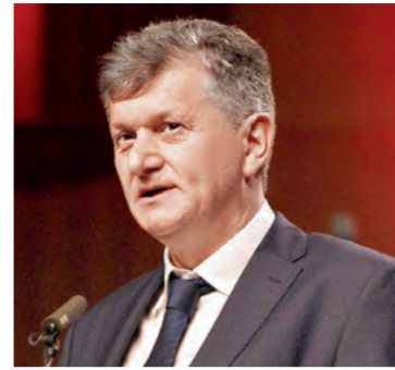
Milan Kujundžić, ministar