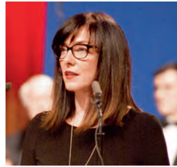
Blaženka Divjak, ministrica