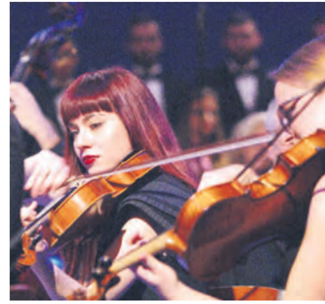
Gudači Muzičke akademije