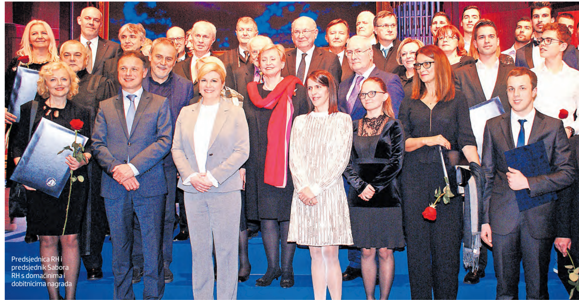
Predsjednica RH i predsjednik Sabora RH s domaćinima i dobitnicima nagrada

GODIŠNJE PUBLICIRAMO IZMEĐU 1100 I 1200 ZNANSTVENIH RADOVA