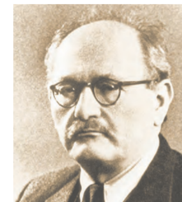
Andrija Štampar 1940./41. i 1952./57.