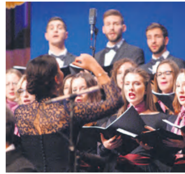
Pjevački zbor "Lege artis"