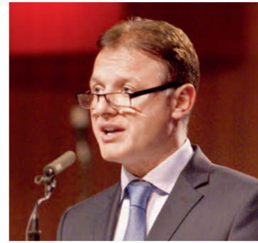
Gordan Jandroković, Sabor RH